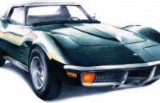
1970 Chevrolet Camaro