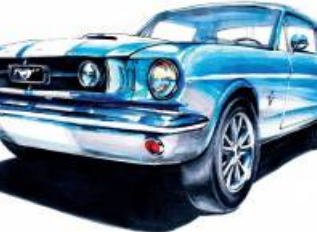
1965 Ford Mustang