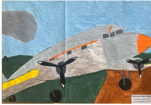
Parés au décollage ! par les écoliers d'Immarmont (PS, MS, GS et CP)