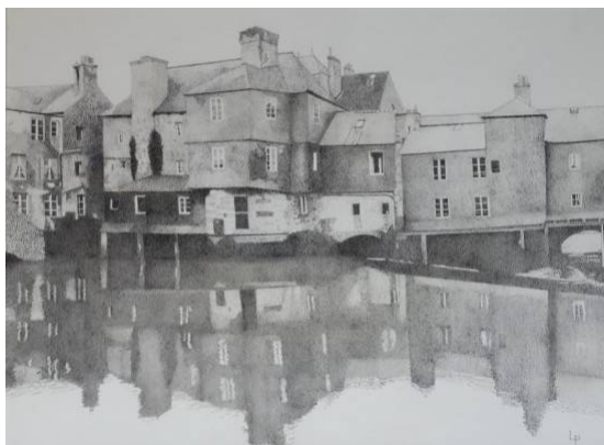
Pont de Rohan

Lucien Poussard , pour l'ensemble de ses œuvres en pointillisme qui ont bluffé le jury.