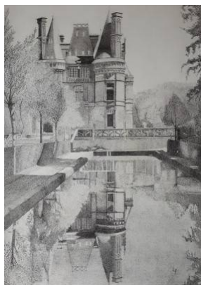
Château de Trévarez