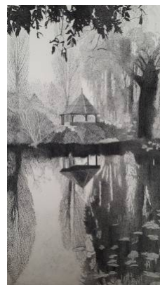
Les étangs de Saint-Ouen-l'Aumône