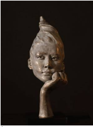
À quoi penses-tu ?