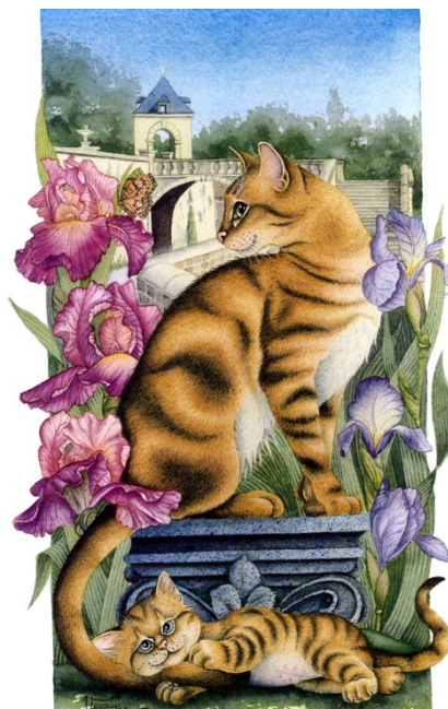
Les Iris du Château d'Auvers

Son parcours artistique débute véritablement en 1971, marquant le début d'une carrière prolifique dans le monde de l'art. Les chefs-d'œuvre de Bernard Vercruyce sont célébrés non seulement pour leur génie esthétique mais aussi pour leur capacité à évoquer un lien profond avec le règne animal.