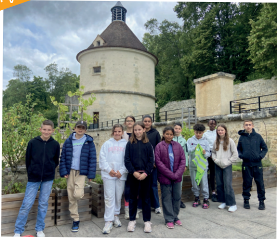
Les Eco'liés : les 3 affiches gagnantes sont exposées dans les cantines pour sensibiliser au tri des déchets et au gaspillage alimentaire.