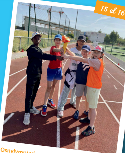
Osnylympiades : défilé avec la flamme et ateliers sportifs au son de l'hymne des JO pour des écoliers à fond la forme !