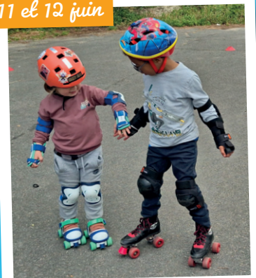
Journées « marche et roule » : entre balade, roller, vélo et trottinette, les maternels d'Immarmont ont relevé tous les défis avec enthousiasme !