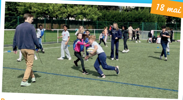
Rencontres Touch rugby de l'USEP pour 10 classes élémentaires d'Yves Le Guern.