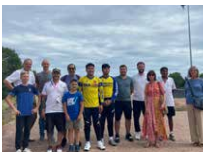
JEUX OLYMPIQUES 2024