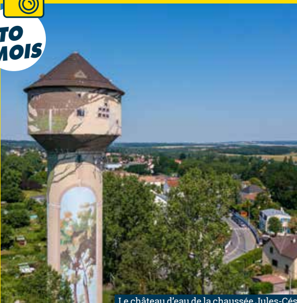
Le château d'eau de la chaussée Jules-César prise par drone, par Marc Chesneau.