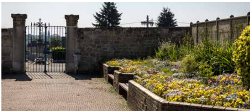
L'entrée historique du cimetière sera prochainement rouverte au public.